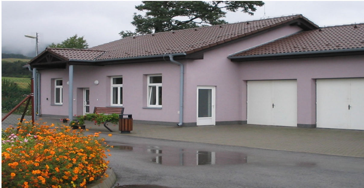
budova - administratívna : súpisné číslo 289 (parcelné číslo 1476/8) :